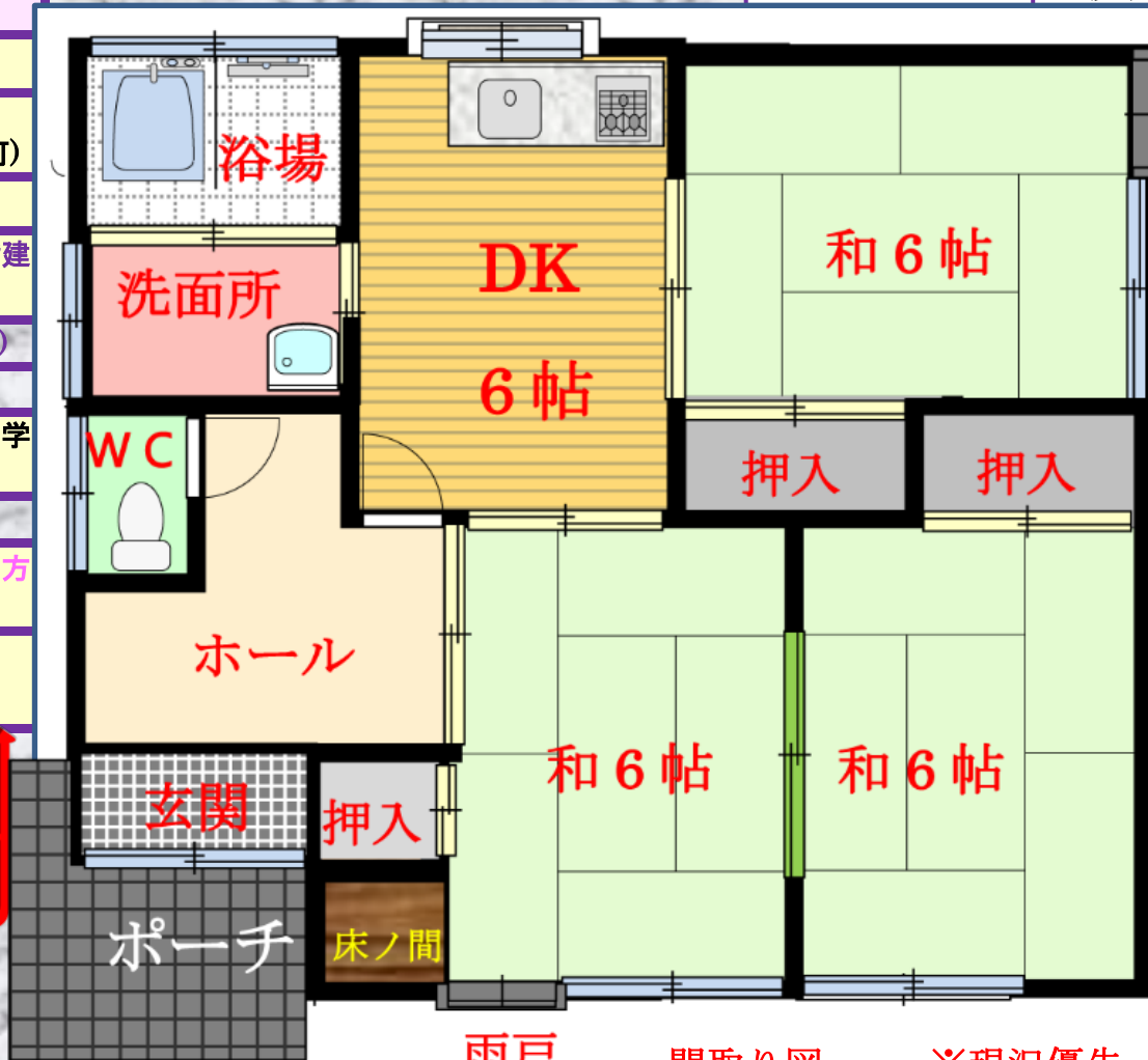
間取り図...※現況優先