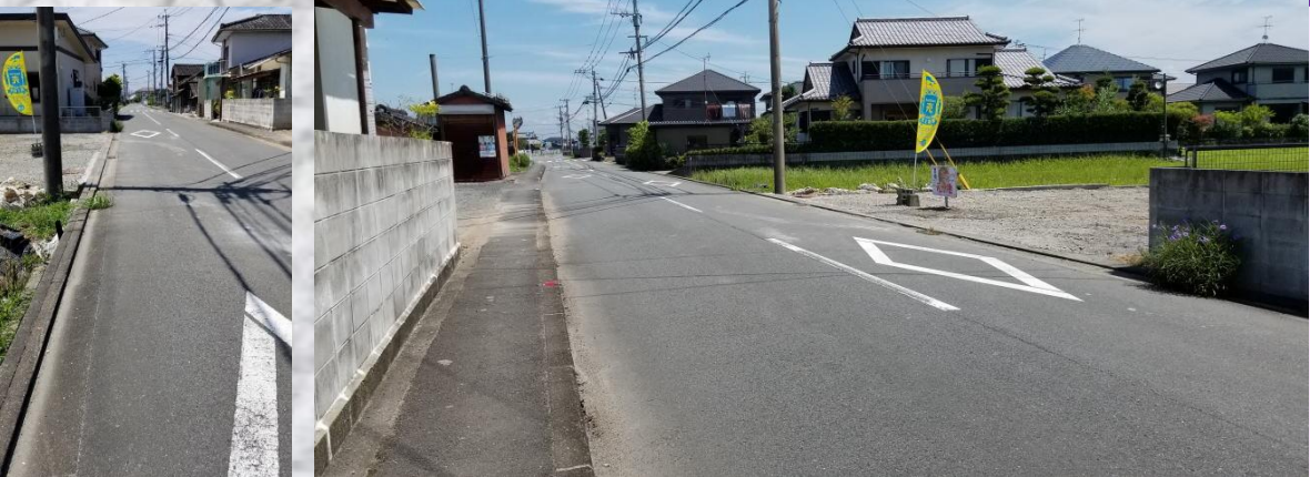
↑ 物件写真 (北側から撮影) ↑ 物件写真 (南西側から撮影)