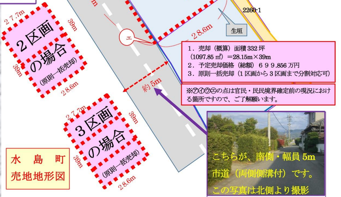
水島町 売地地形図