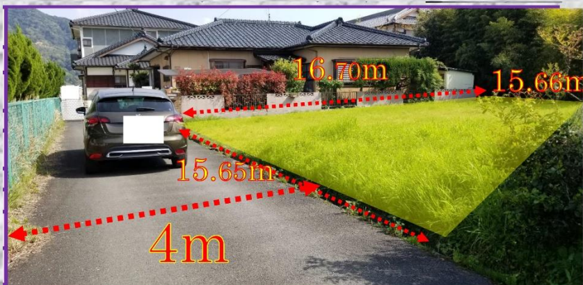
↑ 物件写真①（北側から撮影）

↑ 松健売買物件 009 平山新町売地①案内図②（エフマップ様、住所：八代市平山新町 3144-6）