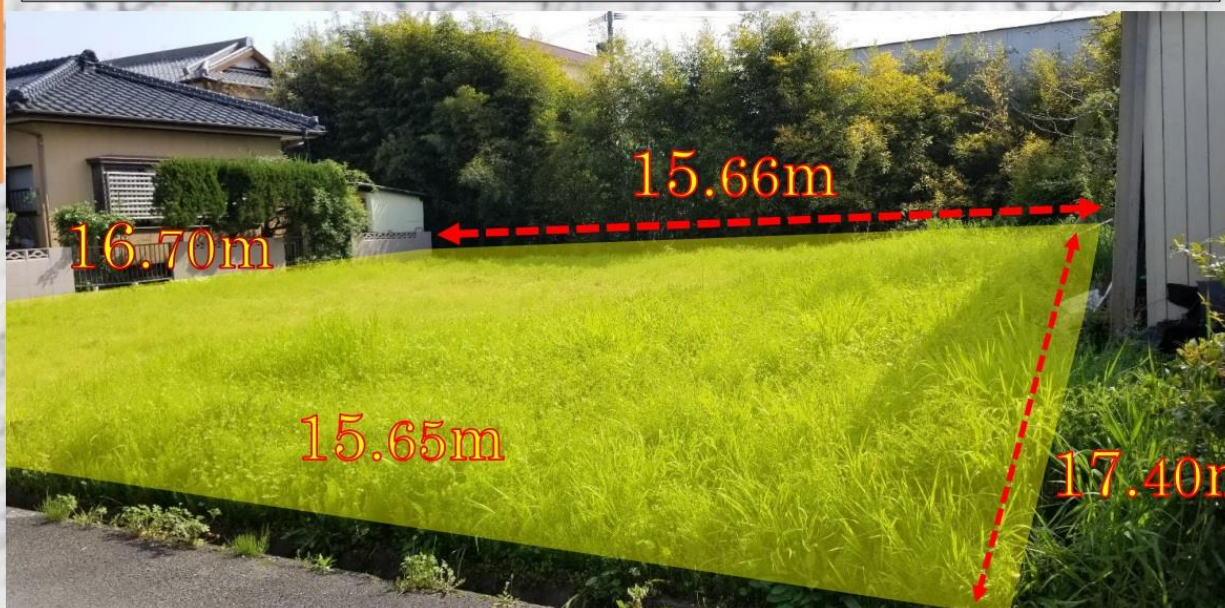
物件写真② (物件写真①より近づいて撮影) →