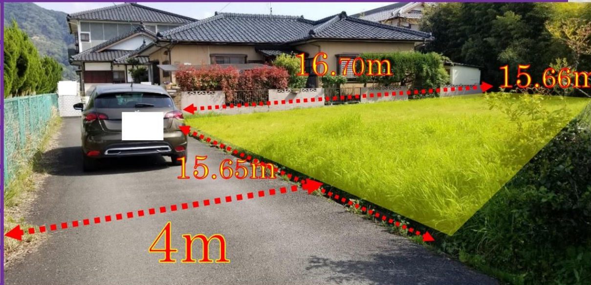
↑ 物件写真① (北側から撮影)